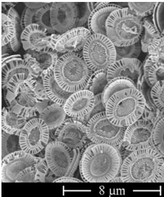
Die marine Algenart Emiliana huxleyi produziert feinstrukturierte Kalkplättchen, die für technische Anwendungen genutzt werden könnten.

Seltenen Erden“, meint die Wissenschaftlerin. „Hinzu kommt auch noch der große Vorteil, dass man die Algen sehr umweltfreundlich in Bioreaktoren praktisch „auf der grünen Wiese“ halten kann. Sie brauchen nur Licht und ein bisschen Nährmedium, sind völlig unkompliziert und nehmen dafür bereitwillig die verschiedensten Elemente auf.“ Für das Recyclingprojekt wird derzeit noch nach Finanzierungsmöglichkeiten gesucht.